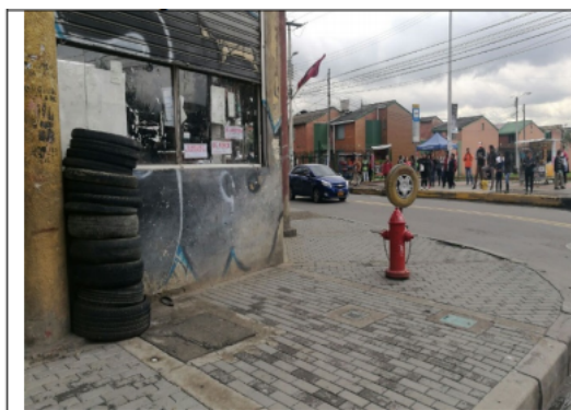
Foto 3. Vista acopio llantas espacio público