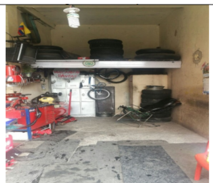
Foto 4. Vista general del establecimiento